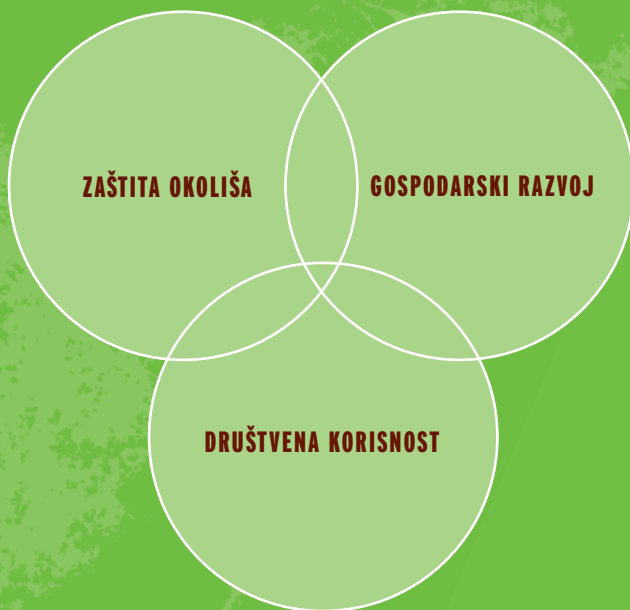
Slika 1. Tri sastavnice održivog razvoja

Održivo gospodarenje šumama znači da je gospodarenje šumom organizirano na gospodarski održiv način, poštujući pritom biološku i društvenu funkciju šume te uvažavajući interese svih zainteresiranih skupina (vlasnika ili upravitelja šume, šumskih radnika, lokalne zajednice, ljubitelja prirode, države i ostalih).