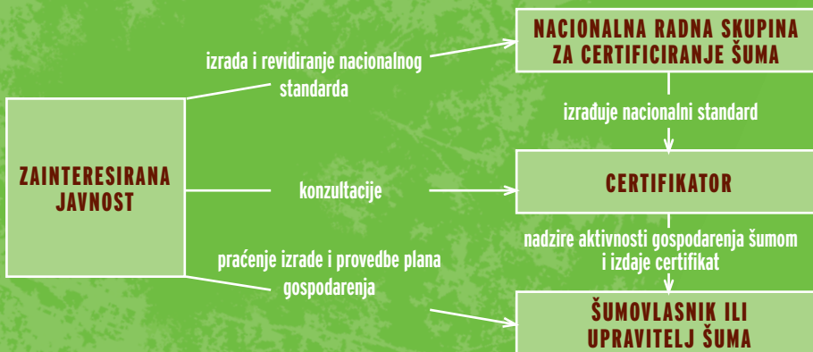
Slika 4. Sudjelovanje javnosti

Želite li se aktivno uključiti u procese održivog gospodarenja i certificiranja šuma, možete to učiniti na jedan od slijedećih načina: